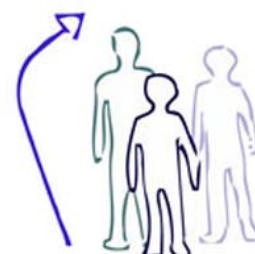
Institut Milton H. Erickson de Rezé